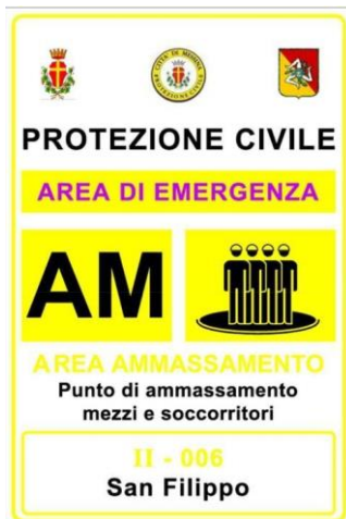
L'area esercitativa è stata individuata presso il palazzetto delle sport "PalaRescifina" sito in via degli Agrumi, c.da S. Filippo, Messina. (38.15648, 15.52538)